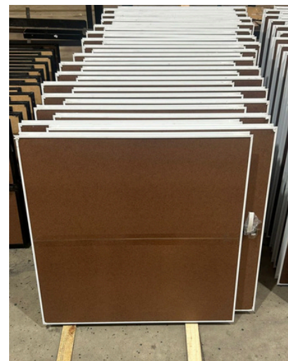
Imagem 3 – Armazenamento de maxim-ar.