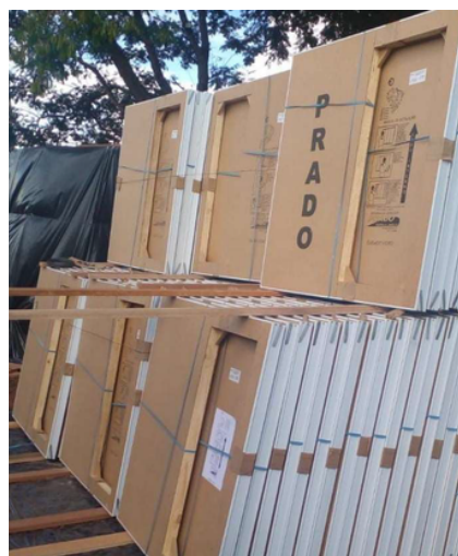
Imagem 5 – Armazenamento de janelas e venezianas (duas colunas).