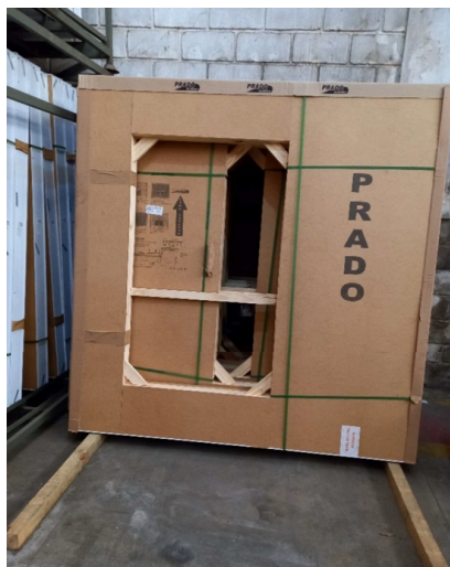
Imagem 2 – Armazenamento de portas de correr.