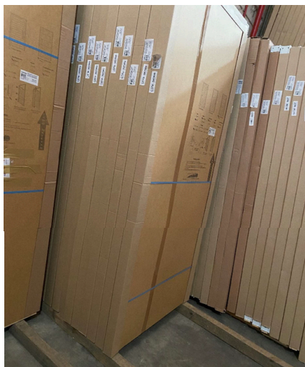
Imagem 1 – Armazenamento de portas de giro.